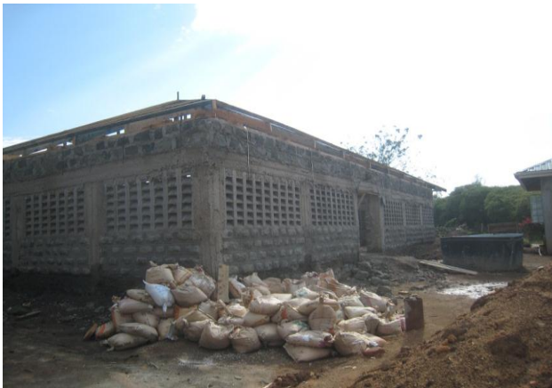
Etat des travaux en septembre 2014