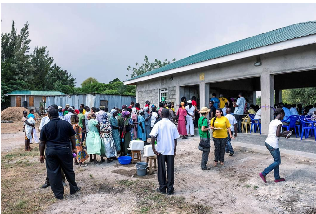
Cantine sur le site de RAFIKI, le jour de l'inauguration. L'eau courante y a été installée.

Grâce au soutien de la commune de Genthod, une cantine a pu être réalisée sur le site de RAFIKI. Ce ne sont pas moins de 300 convives qui l'ont inaugurée le 27 juillet 2013, lors des cérémonies officielles.