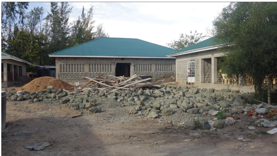
Etat des travaux en octobre 2014