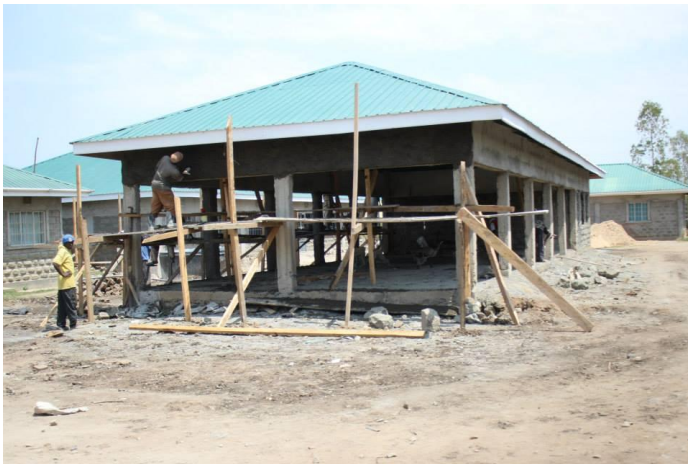
Etat des travaux en juillet 2014

Il est destiné à recevoir les grandes réunions organisées par RAFIKI. C'est également sous cet espace que les enfants produisent leurs spectacles lors d'événements importants.