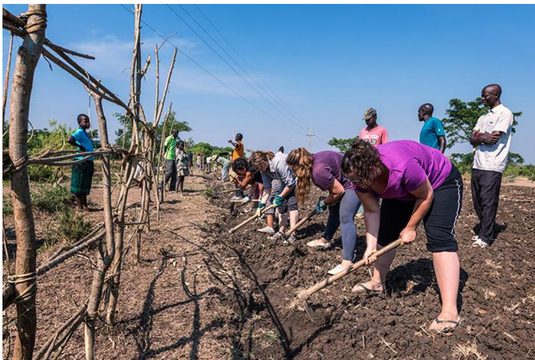
Le groupe « droits de l'enfant » labourant un champ qui permettra de nourrir des orphelins.

Composé de 12 personnes, ce groupe a travaillé dans et avec les communautés, surtout les enfants. Il a construit des enclos, nettoyé des étangs, labouré des champs et construit des latrines.