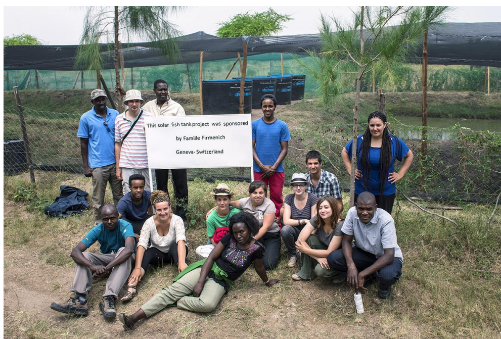
Le groupe de la ferme à poisson sur le site de RAFIKI devant la ferme terminée.