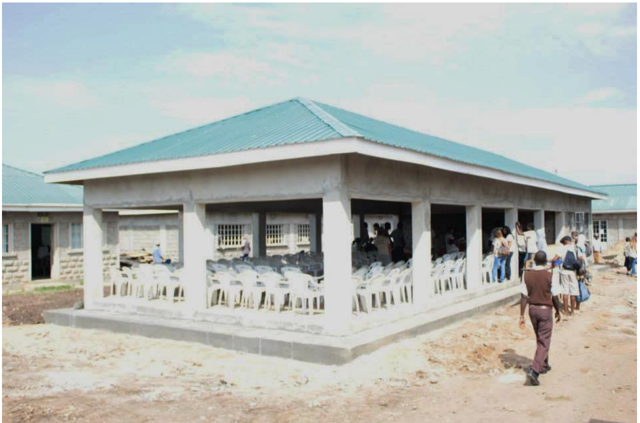
Préparation du Yann Hall pour la cérémonie de départ du groupe Solferino le 7 août 2014.