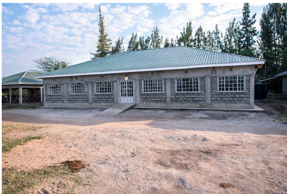
Centre de production artisanale sur le site de RAFIKI.

Grâce au soutien de Genève Ville Solidaire, le centre de production artisanale a pu être construit. La couture, le tissage, le vannage possèdent maintenant leur centre de production et leur boutique.