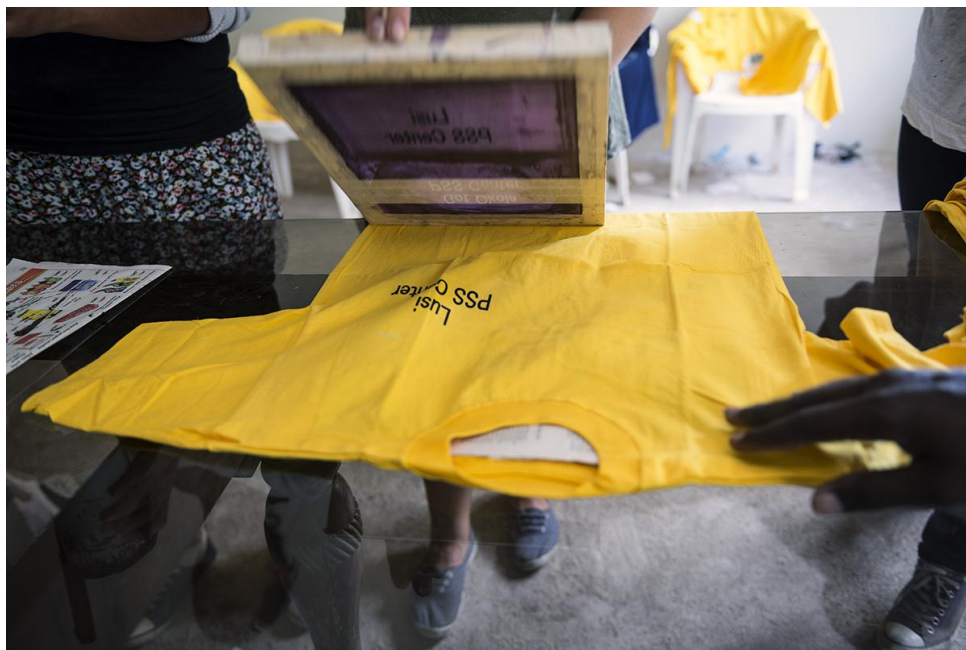
Impression des noms des écoles pour les 2'600 enfants des cinq communautés dont s'occupe RAFIKI.

Il a également réalisé plus de 1'500 T-shirts et tenté de fabriquer des savons. Ce projet a toutefois dû être abandonné en raison du manque de mesures de sécurité.