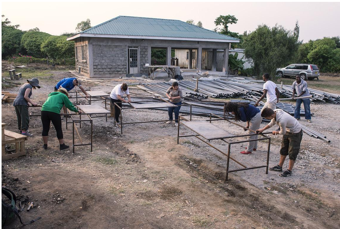
Le groupe sur le site de RAFIKI en pleine construction et peinture de tables pour la cantine en arrière-plan.