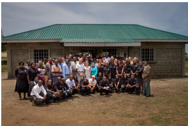
Bureau central de RAFIKI et atelier bois (11 établis) construits à Pâques 2012