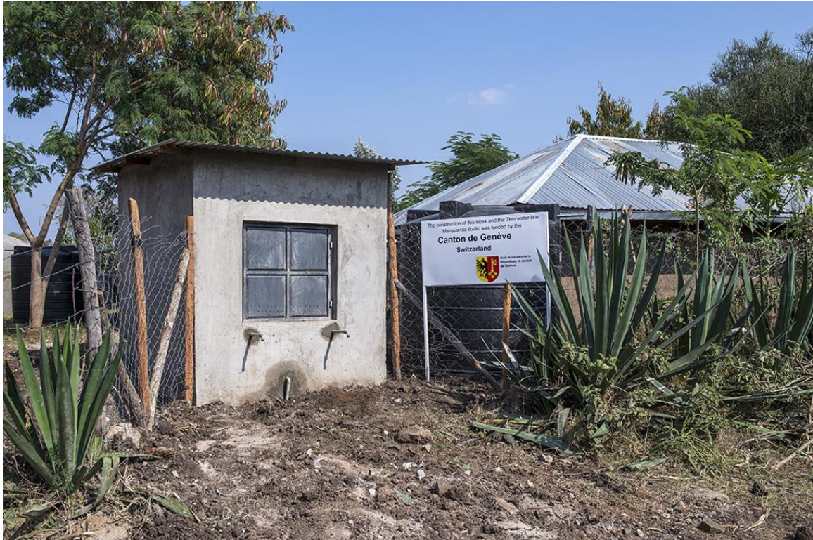
Arrivée de l'eau potable à RAFIKI.