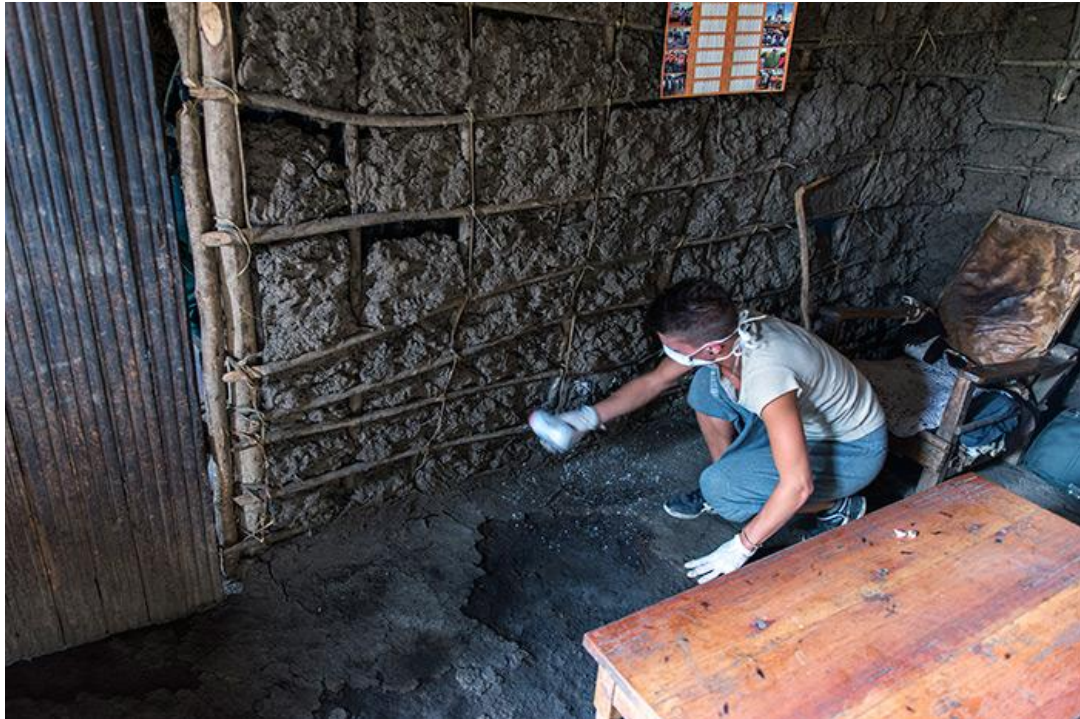
Désinfection de maison

De plus il a pris en charge deux personnes pour des soins particuliers (curetage et désinfection de plaies profondes) avec transport au dispensaire tous les deux jours.