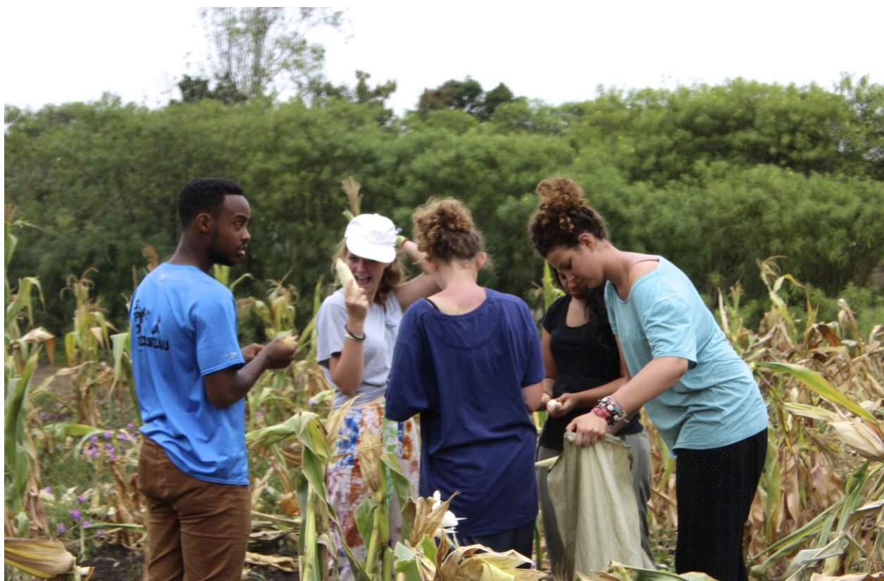
Comme la dame va utiliser le maïs pour en faire une pâte, il faut enlever tous les grains des épis.