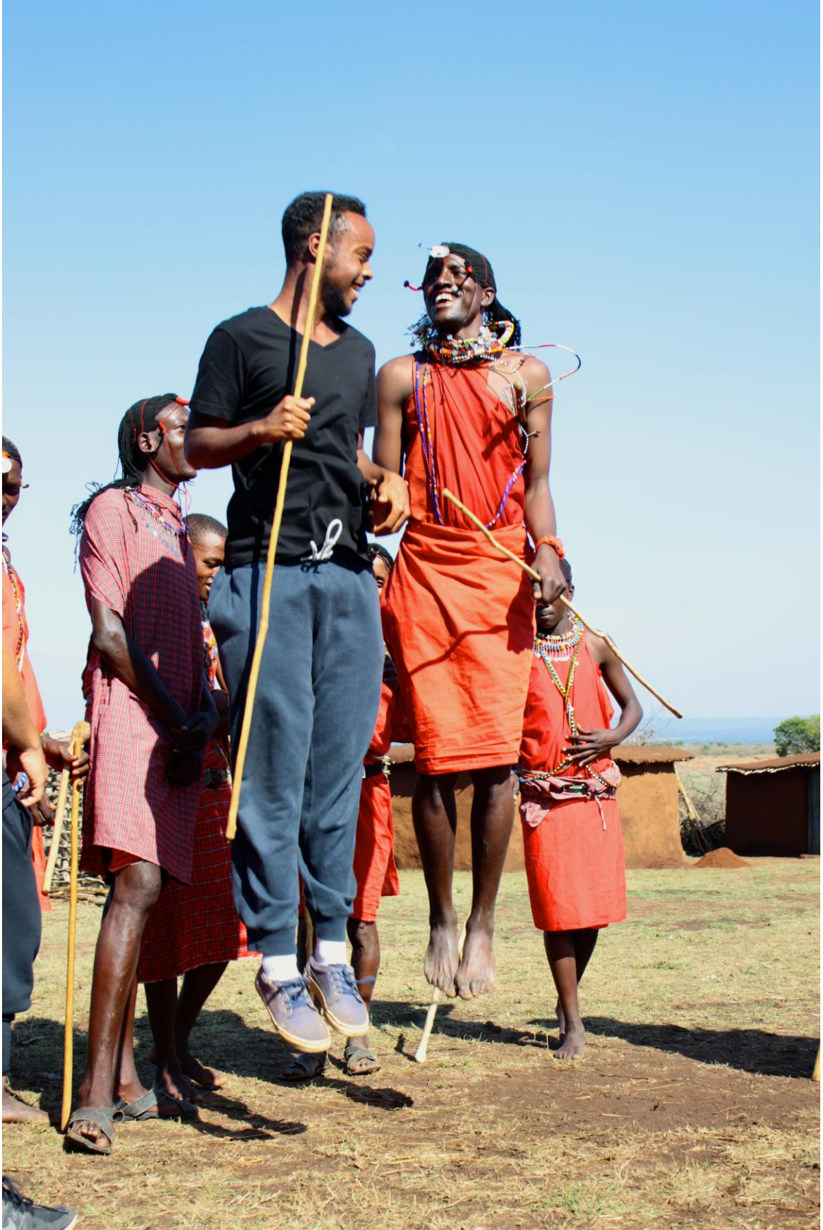
Un saut imprévu dans un village Massai.