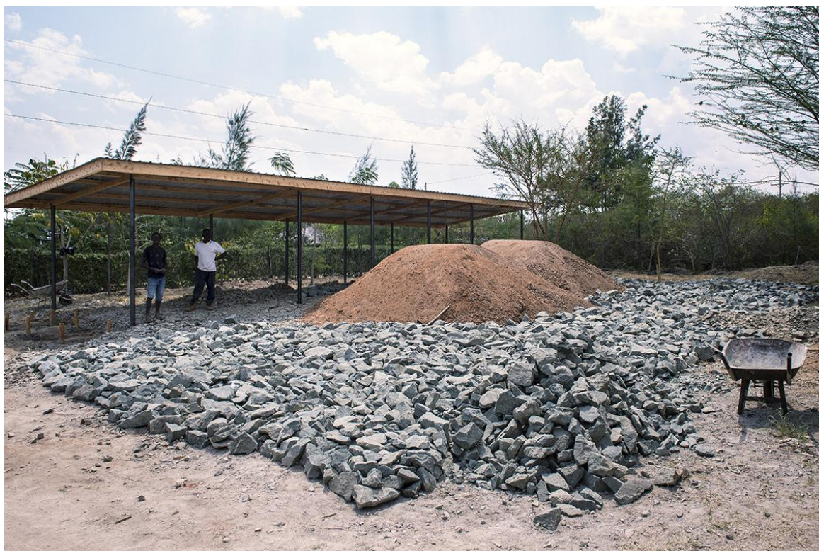
Chantier du futur parking ombragé à l'entrée du site de RAFIKI.