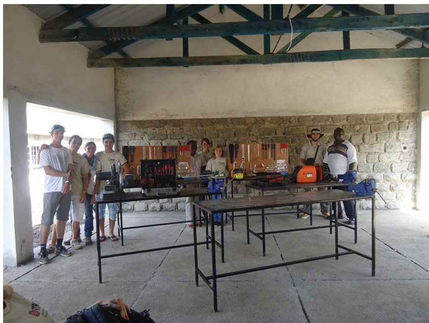
Les jeunes de la métallurgie et de la peinture derrière leurs réalisations.