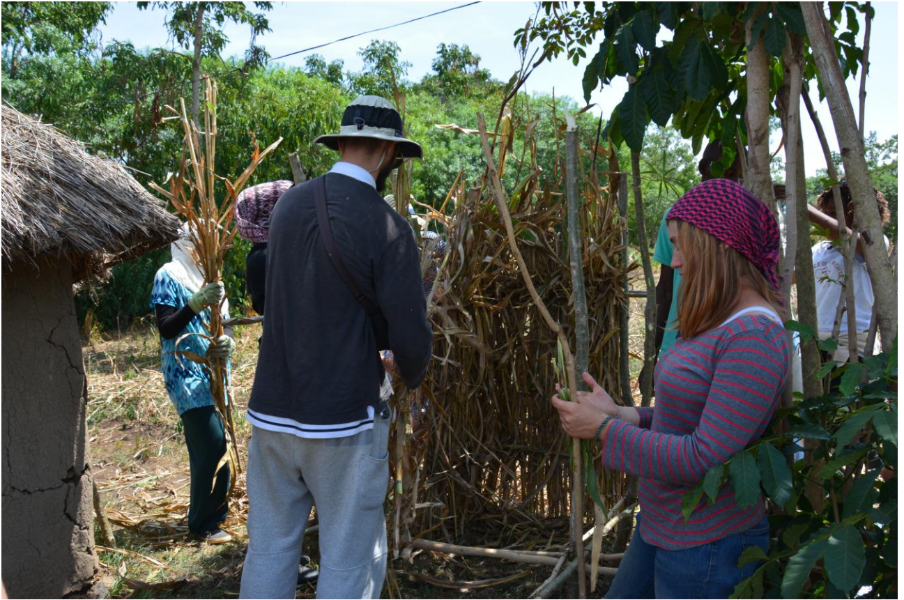
Le groupe a aussi réalisé une salle de bain pour une famille.