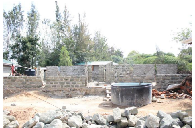
Etat des travaux en juillet 2014

Financés par Genève Ville Solidaire , ces trois ateliers regroupés sous un même toit permettront de former des jeunes apprentis à la soudure, la plomberie et la maçonnerie. Les ateliers seront opérationnels dès janvier 2015. Une classe de 12 apprentis ouvrira pour chaque formation. L'année suivante les effectifs seront doublés.