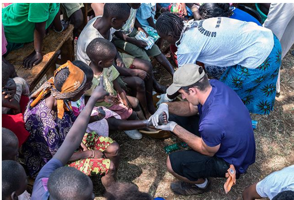
Groupe « santé » soignant les pieds d'enfants atteints par les jiggers.

Le groupe santé, composé de 12 membres, dont les apprentis du CPFS, ont participé à une campagne d'éradication des jiggers (chique). Après deux jours de formation, le groupe a visité 35 villages où il a pratiqué des actes médicaux (retirer les poux, baigner et désinfecter les pieds), pulvérisé et nettoyé les maisons. Il a également participé à une vaste distribution de chaussures (plus de 2'000 paires).