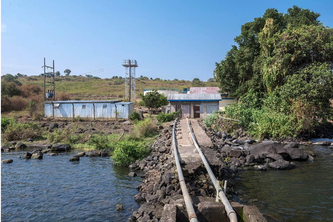
Station de pompage du lac Victoria – départ des 9 km de canalisations