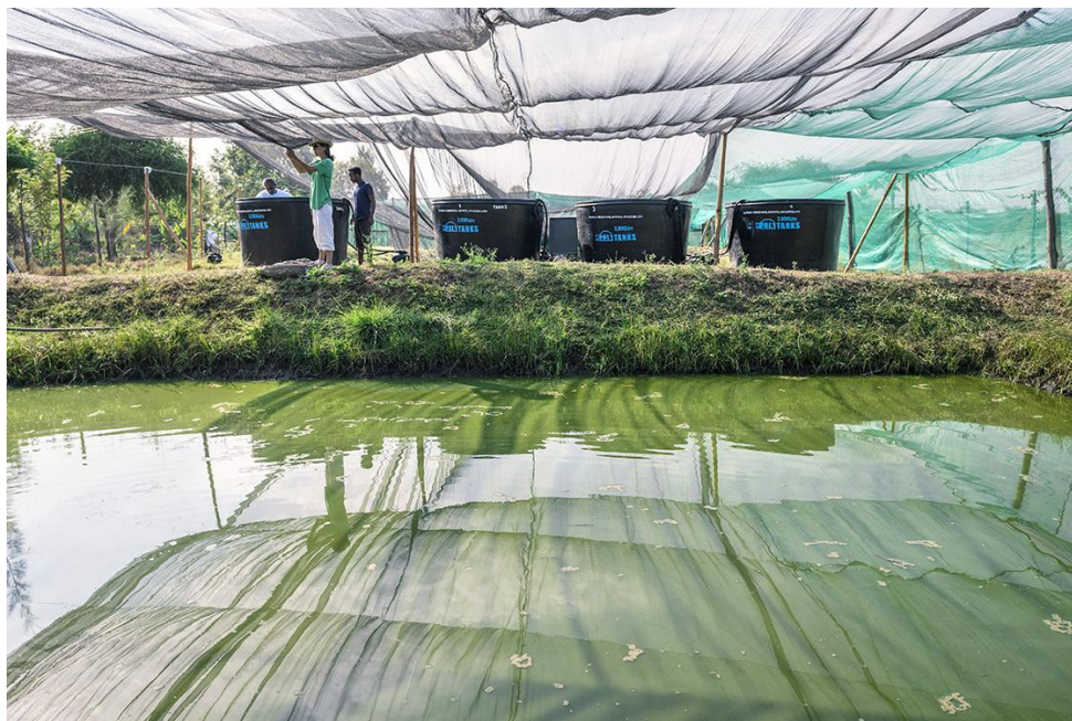
Ferme solaire à poissons sur le site de RAFIKI.