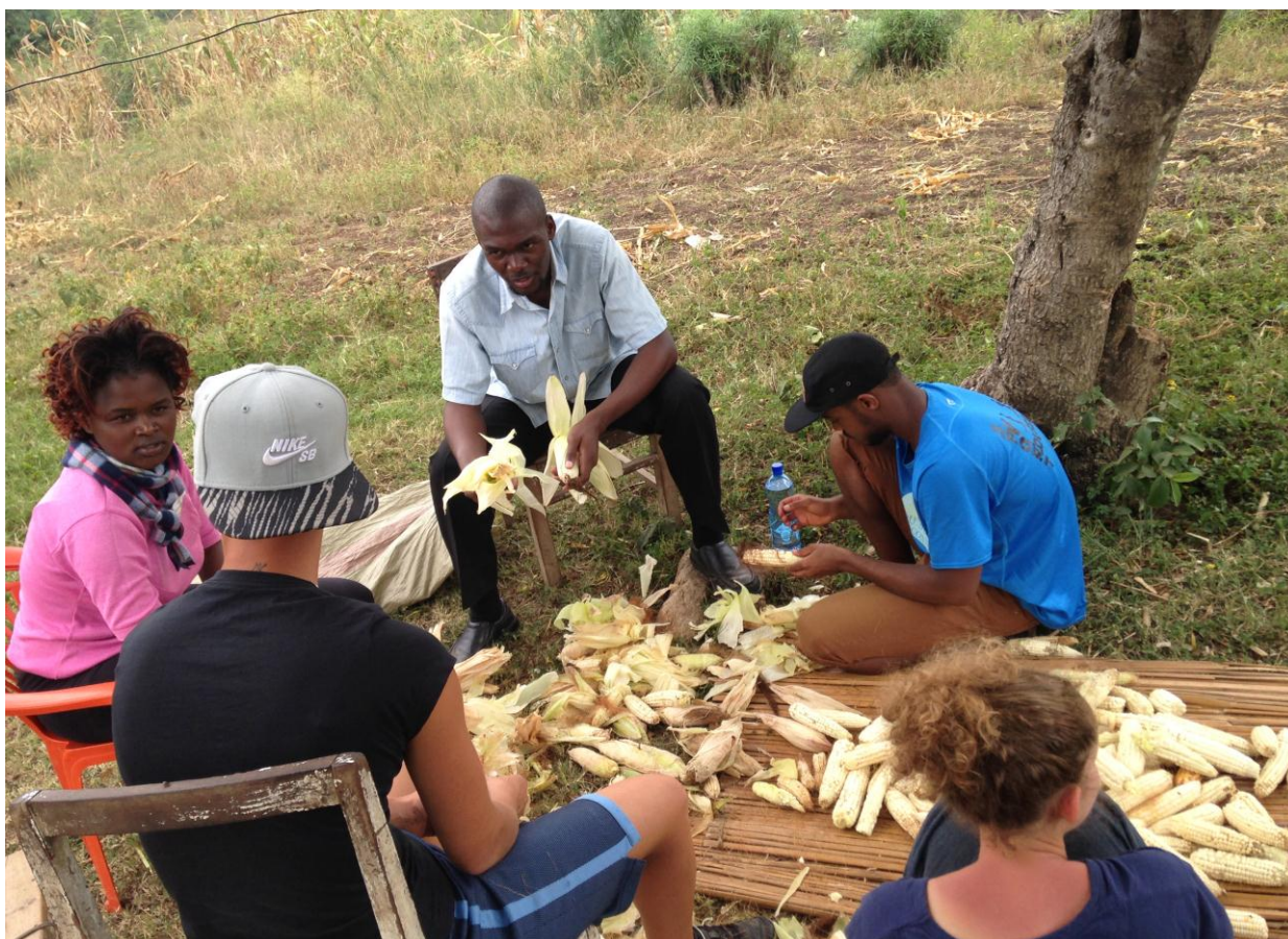
Du maïs a été récolté.