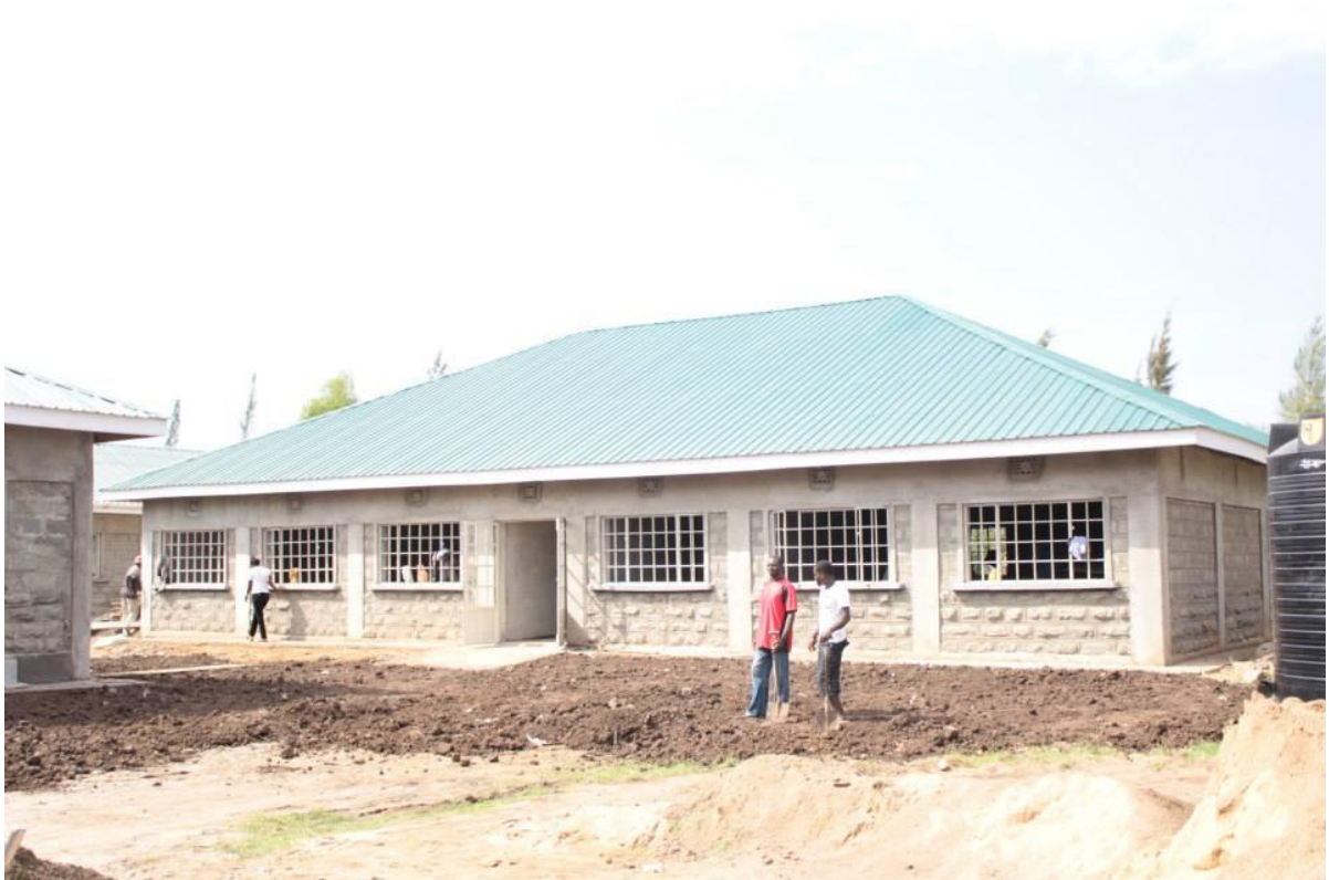
Etat de la construction en septembre 2014