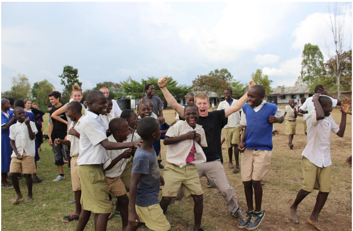
Ces moments de détente et de jeux permettent de nouer des liens et des défis pour le vendredi suivant...