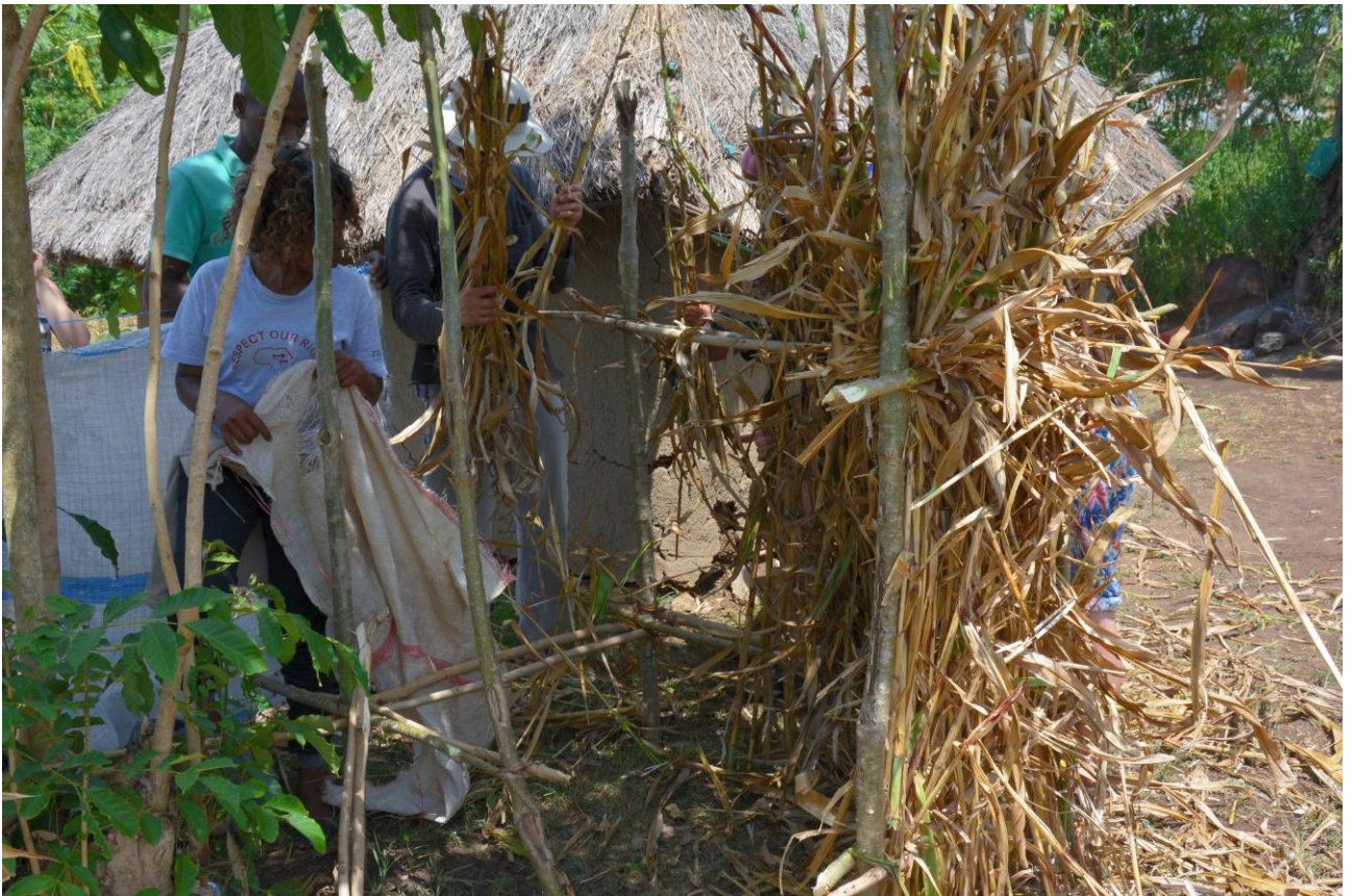
Un coin intime à l'abri des regards.