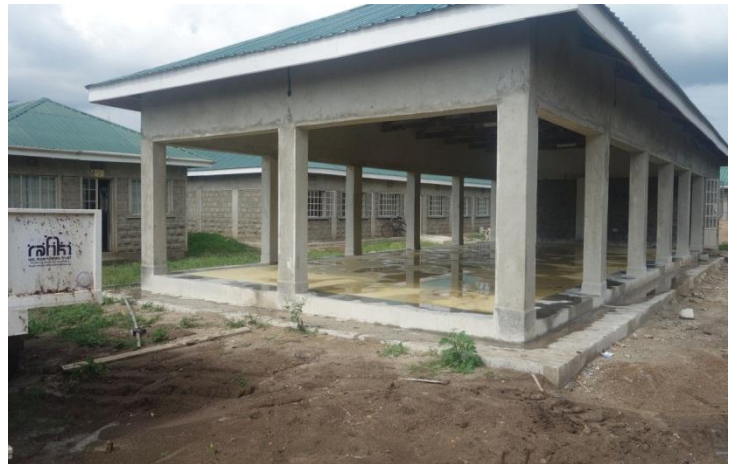
La dalle bicolore est achevée en août 2014