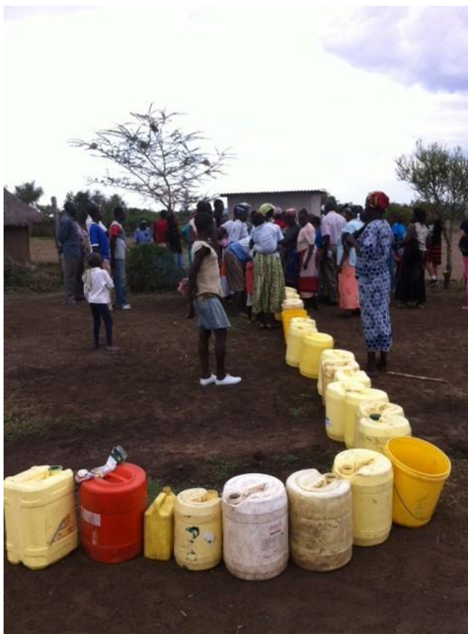
Distribution de l'eau à un kiosque. Chacun s'acquitte de 3 shillings pour un jerricane de 20 litres (1 shilling pour l'eau, 1 pour le préposé au kiosque et 1 pour l'entretien du kiosque).

Grâce à la motivation de toutes et tous, l'eau potable est arrivée à RAFIKI le 26 juillet, soit un jour avant l'inauguration des projets.