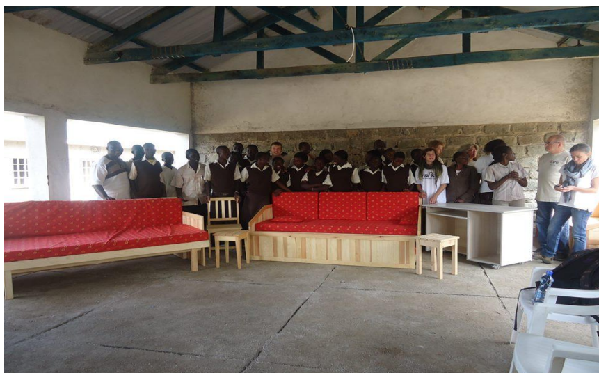
Les jeunes des ateliers bois et couture derrière leurs réalisations.