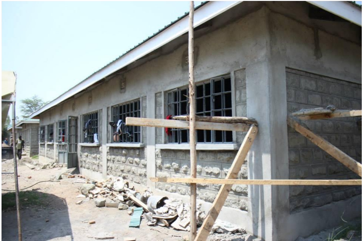
Etat de la construction en juillet 2014

Financé par le Canton de Genève – Service de la Solidarité Internationale , ce bâtiment regroupe la bibliothèque ainsi que des salles de cours et de réunions.